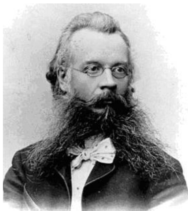
Рис. 1. Фотографический портрет Н.М. Ядринцева, выполненный В. Павловским

литературных, публицистических, эпистолярных произведениях Н.М. Ядринцев выстраивал идеальный конструкт, воплощавший поведенческие стратегии интеллигента-патриота. Запечатлен образ мыслителя, активного деятеля и на фотографиях: например, портрет Н.М. Ядринцева, изготовленный фотографом В. Павловским, изобразил задумчивого, интеллигентного человека, на что обращают внимание и очки, и одежда лидера областничества (рис. 1). В начале 1890-х годов В. Павловский стремился запечатлеть богатый исследовательский, бытовой, литературный опыт Н.М. Ядринцева, накопленный им к пятидесятилетнему возрасту. Неслучайно именно этот фотографический портрет был выбран К.О. Брожем для иллюстрации памяти о Н.М. Ядринцеве после его смерти в 1894 году в журнале «Всемирная иллюстрация» (рис. 2) 2 .