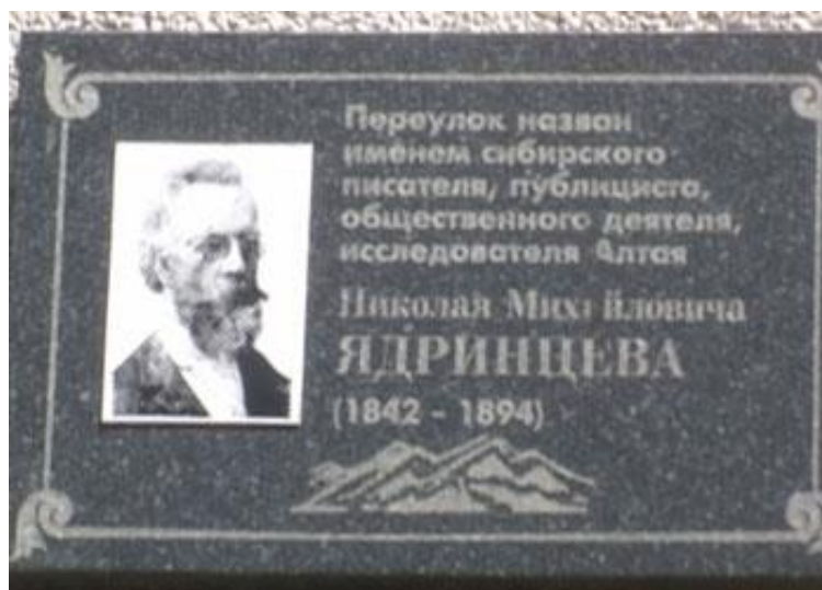
Рис. 4. Мемориальная доска Н.М. Ядринцеву в Барнауле (переулок Ядринцева, 146)

Н.Н. Ефремова отмечала, что на протяжении последних полутора столетий портрет претерпел эволюцию: от официального, фиксирующего особенности внешности выдающегося человека, он приобрел черты психологического портрета-образа 11 . С помощью портрета-образа зритель получает возможность вырабатывать собственное суждение об исторической личности и о времени создания памятных символов. К категории портрета-образа относится мемориальная доска с барельефом Н.М. Ядринцева в городе Омске, которая дает наглядное представление об интеллигенте XIX века: о способности критически мыслить, сопереживать судьбе родины и народа, а лаконичная надпись на мемориальной доске — об основных направлениях деятельности Н.М. Ядринцева: публицистическом, общественно-просветительском, исследовательском (рис. 5).