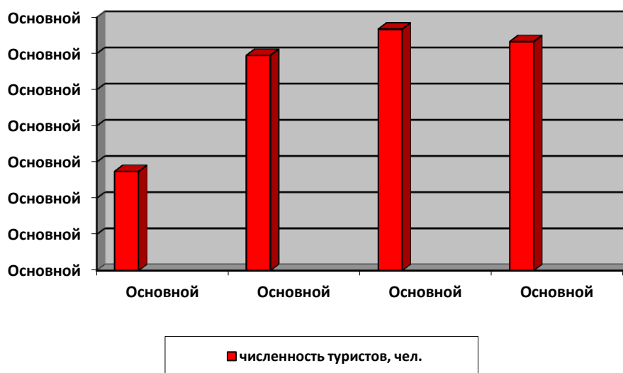
Рис. 3. Численность туристов в Окском заповеднике по числу проданных экскурсий

Численность туристов, посещающих объекты ООПТ, постоянно увеличивается. Наиболее посещаемым является Окский заповедник, в котором туристский поток в 2015 году, по сравнению с 2007 годом, увеличился в 2,3 раза и составил 12,7 тыс. человек (рис. 3).